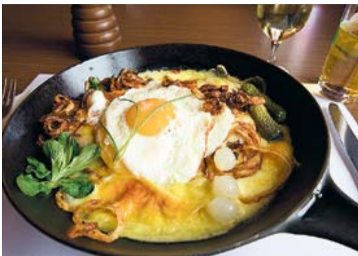
Panorama: Wintersonne auf dem Grimselpass (oben). En Guete! Walliser Käseschnitte (links). Erinnerungen: Souvenirs im Hotel Grimselblick

Eine Passwanderung auf die Grimsel belohnt mit «Natur pür»